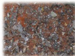
MIX (RAME, ALLUMINIO)