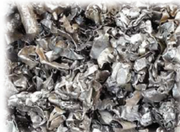
ROTTAME FERRO E ACCIAIO (PROLER)