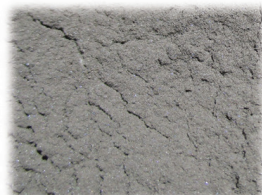
SILICIO IN POLVERE